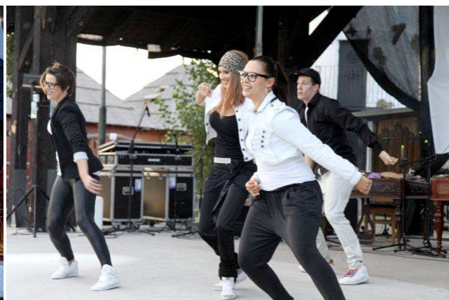
Credance a Partia

Po realizácii Letnej akadémie a Cigánskom bašaveli nasledovalo vyútovanie partnerom a záverečné správy z projektu pre partnerov, ktorý konkrétne podporili iba Letnú akadémiu a Mini Cigánsky bašavel. Letná akadémia