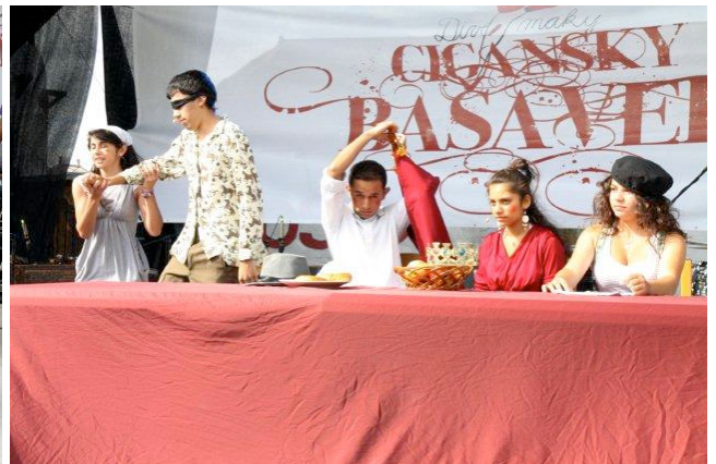
Divadelníci – vystúpenie divadelníkov